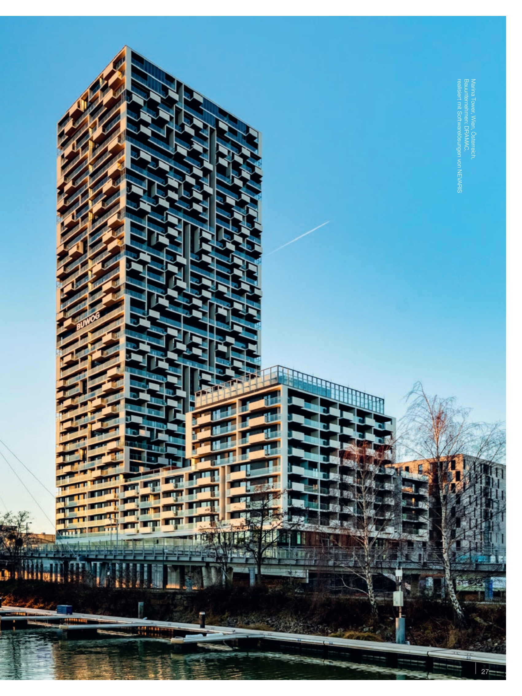
Marina Tower, Wien, Österreich, Baunehmen: DRAMAAC, realisiert mit Softwarelösungen von NEVARIS