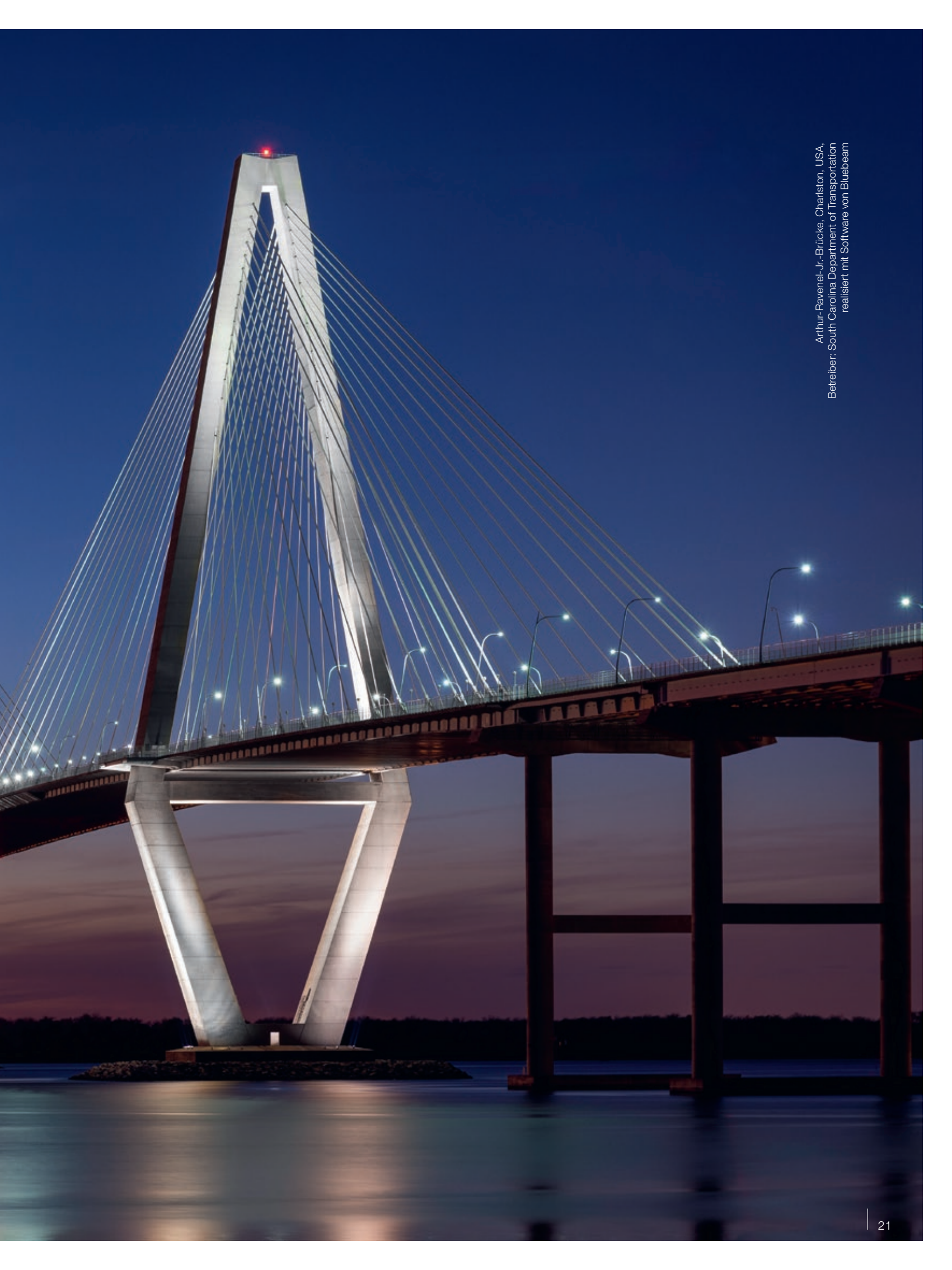
Arthur-Ravenel-Jr.-Brücke, Charleston, USA, Betreiber: South Carolina Department of Transportation realisiert mit Software von Bluebeam