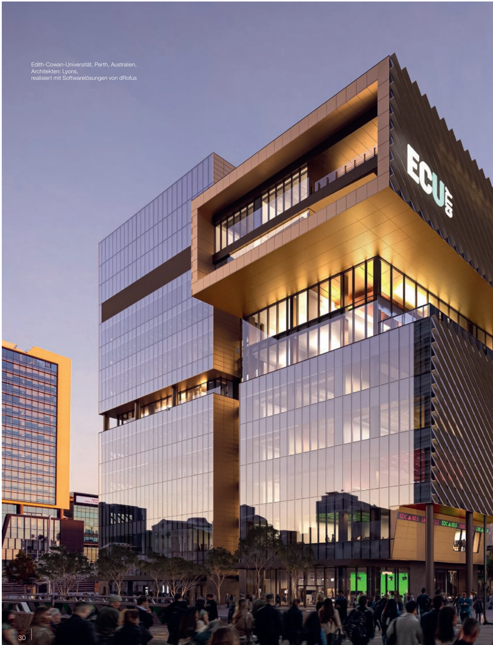
Edith-Cowan-Universität, Perth, Australien, Architekten: Lyons, realisiert mit Softwarelösungen von dRofus